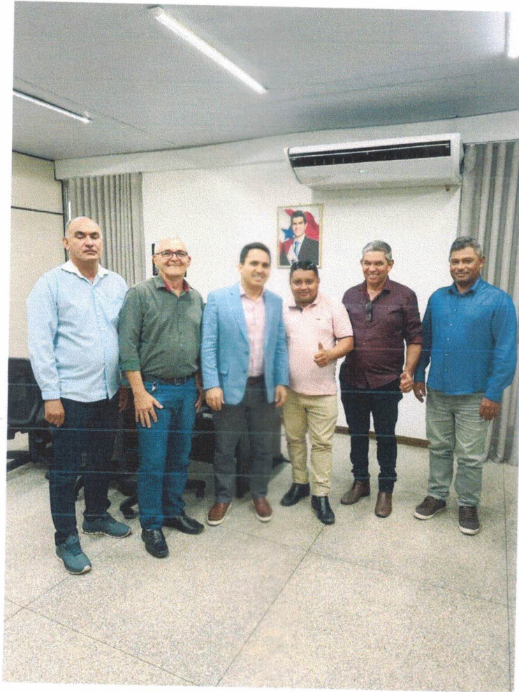
SECRETARIA DE ESTADO E ESPORTE E LAZER CÁSSIO ANDRADE