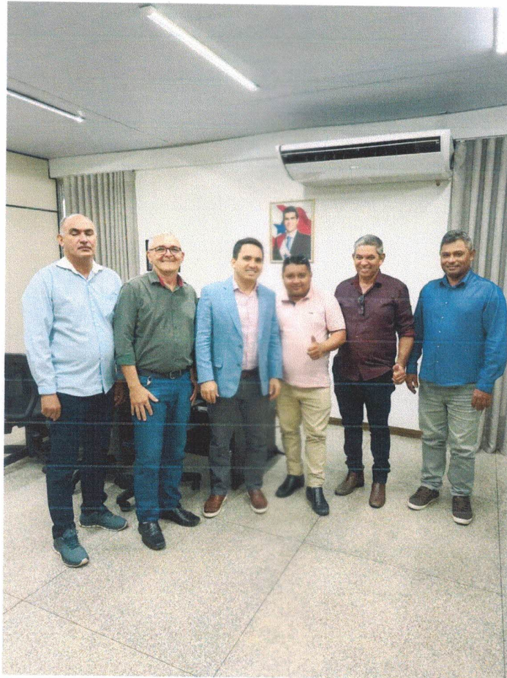
SECRETARIA DE ESTADO E ESPORTE E LAZER CÁSSIO ANDRADE